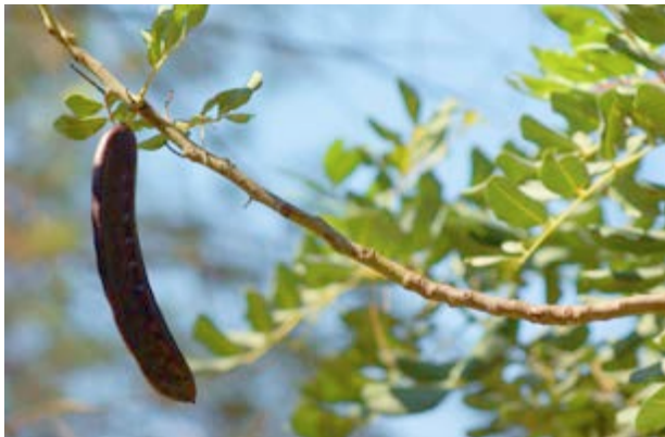
El algarrobo, ¿un cultivo del pasado?

Con un poco de suerte escucharás el canto de un petirrojo , el tamborileo característico del picapinos o los pasos apresurados de un zorro . Quizá también te sientas observado por una gineta .