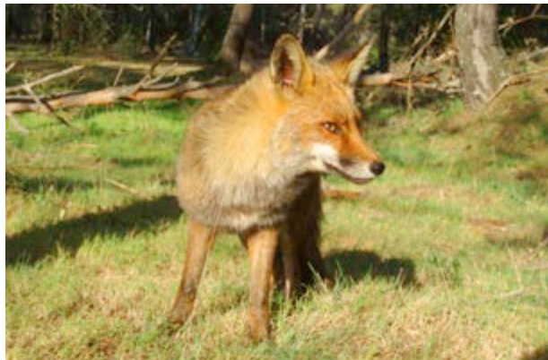
El zorro está muy ligado a la vida rural

Acércate al paraje. Deja que te acoja, que te acune su silencio, que te llene de energía. Pasea y siente. ¿A que parece que aquí no pudiera pasarte nada malo?