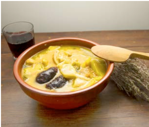
Tradicional olleta de Vilafamés

En 1880 se contaron 110 almazaras en todo el término municipal, que entonces incluía también a Sant Joan de Moró y la Vall d'Alba. Aunque el olivo mantiene su importancia, con ejemplares milenarios, la vid fue perdiendo fuerza. El trigo , los algarrobos , los almen-dros y los higos completaban la parte más importante de las cosechas.