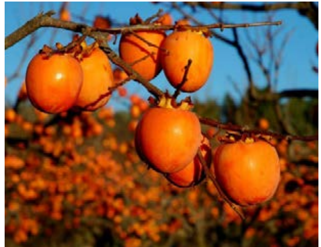
Los caquis dan color al campo