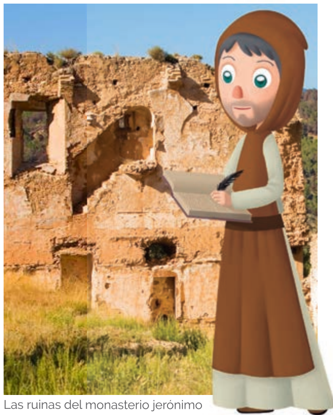
Las ruinas del monasterio jerónimo

asentarse la orden correctamente al no poderse terminar toda la edificación. Después, en el siglo XIX, vendría la desamortización, el abandono obligado y la ruina. En 1992 se realizaron excavaciones que proporcionaron información sobre la importancia del monasterio, pero apenas quedan vestigios de ello. Es emocionante dejar libertad a la imaginación y reconstruir cómo debía de ser la vida agraria de los alrededores.