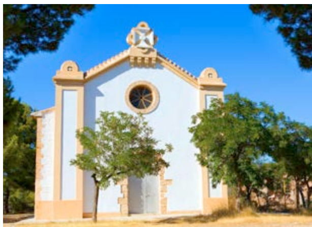
En la cima del Monte de la Esperanza

Si te decides por disfrutar de la pinada de pino carrasco , bajo los árboles encontrarás coscoja, espino negro , alguna sabina y ro-