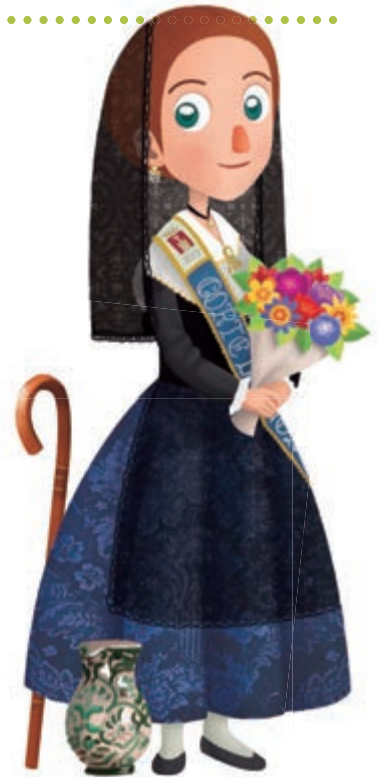
Indumentaria tradicional de segorbina

Y tampoco puedes olvidarte de que la Vía Verde de Ojos Negros pasa muy cerca alrededor de su kilómetro 50. Sin duda es un plan diferente con el que contar si se es aficionado a la bicicleta. Y si te gusta recorrer montañas, ya sabes que el Parque Natural de la Sierra de Espadán y el Parque Natural de la Sierra Calderona están aquí mismo.