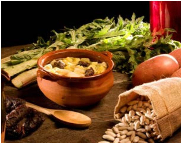
La contundente Olla Segorbina

Los pasteles de boniato te esperan en invierno y las tortas de panquemao con nueces y pasas, la torta de manzana , la torta de colorado y el pan artesano durante todo el año.