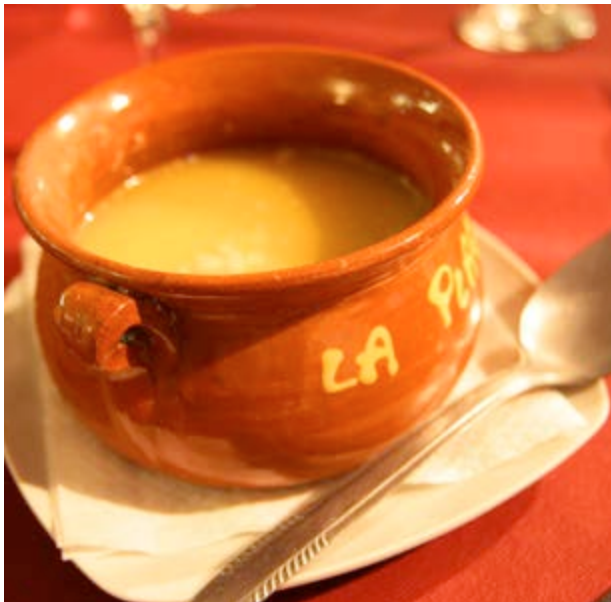
La olleta es perfecta para reponer fuerzas

Las carnes son contundentes y sabrosas desde el tombet al ternasco o las carnes a la brasa y los embutidos . Para cuando hace falta algo caliente que entone el cuerpo, la olleta , el arroz al horno o el arroz con bacalao son lo mejor.