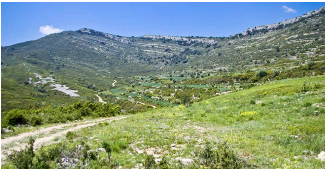
A través de los senderos podrás descubrir el paisaje rupícola

Apenas son 7 kilómetros aunque con cierto desnivel, que te llevarán por paisajes que, a primera vista, parecen inhóspitos pero que son de una belleza inmensa .