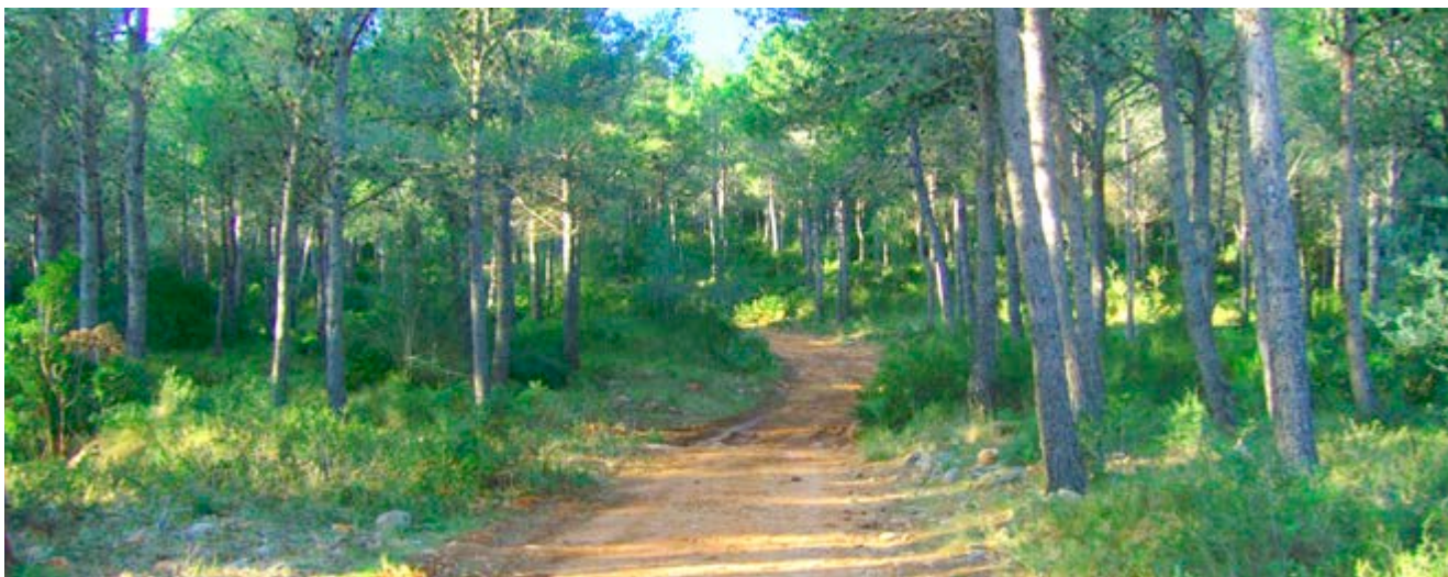
De bovalar a bosque, la evolución de un paisaje

Con el transcurrir del tiempo, la ganadería fue perdiendo importancia y los terrenos debieron buscar nuevos usos , como los hornos de cal , o el aprovechamiento de la madera por lo que, en 1955, se repobló con pino carrasco . Y así es como lo disfrutamos ahora, pese a lo pequeño y joven que es, sientes que estás en todo un bosque maduro.