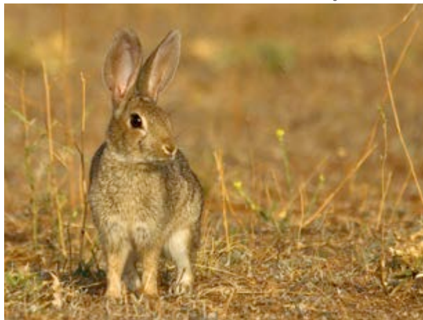
El escurridizo conejo de monte

de descanso en el paraje es la mar de sencillo y cómodo.