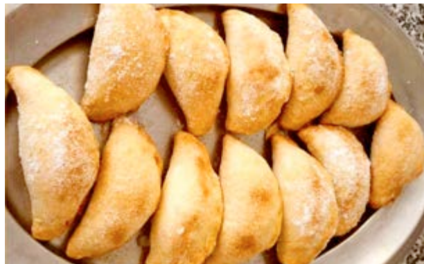
Los deliciosos flaons

sitar muchas para el camino en sí, pero es que en cuanto entres y preguntes por las delicias típicas de Forcall vas a querer probar una de cada.