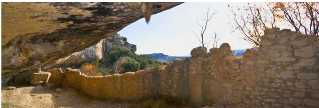
En la Cova de la Carn tradicionalmente se ha guardado el ganado

Algo que no todo el mundo sabe es que, según cuenta la leyenda , el caballo de Santiago Apóstol saltó de la Mola de la Vila a la de Cosme y dejó marcado su casco, la pota .