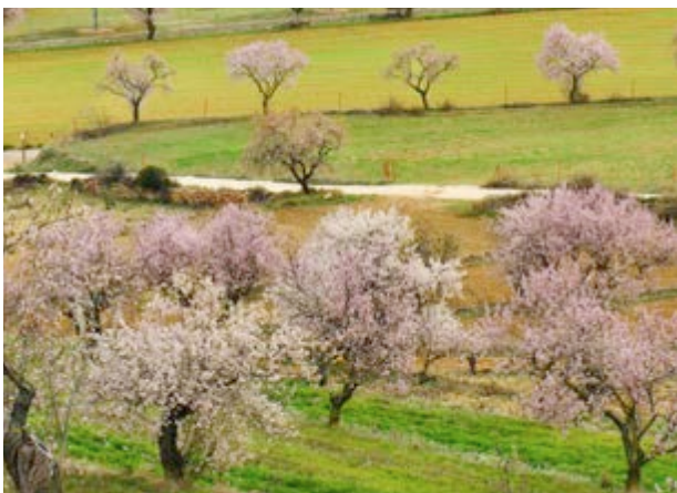
Los almendros dan color al paisaje

Antes de subir al paraje pasa por el horno y compra provisiones. No es que vayas a nece-