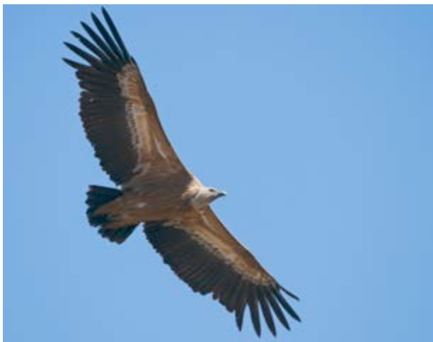
El buitre leonado impresiona por su tamaño

Además, en este paraje encontramos especies de plantas y árboles que no siempre son fáciles de ver, como los serbales , que otorgan una nota de color rojizo muy vivo cuando llega el otoño. Carrascales acompañados de quejigos y boj se alternan con pinares salpicados de enebros y sabinas . Y mira dónde pones el pie porque también verás orquídeas en primavera.