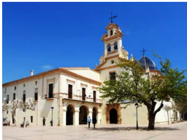
La Basílica del Lledó

dad sin visitar su Concatedral de Santa María y su Basílica del Lledó .