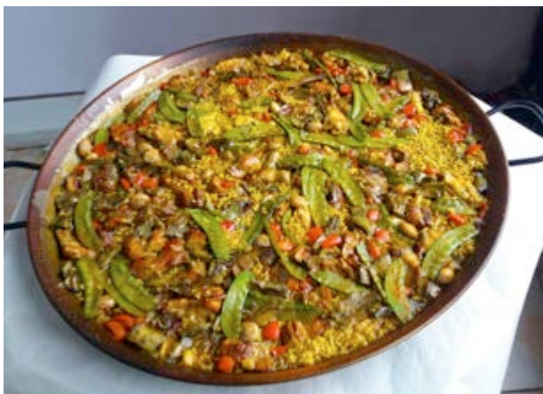
Los arroces, la delicia de Castellón

La paella con pelotas de carne , sobre todo en invierno, es solo uno de los tipos de arroz que podrás degustar. Arrosejat, a banda, cal-