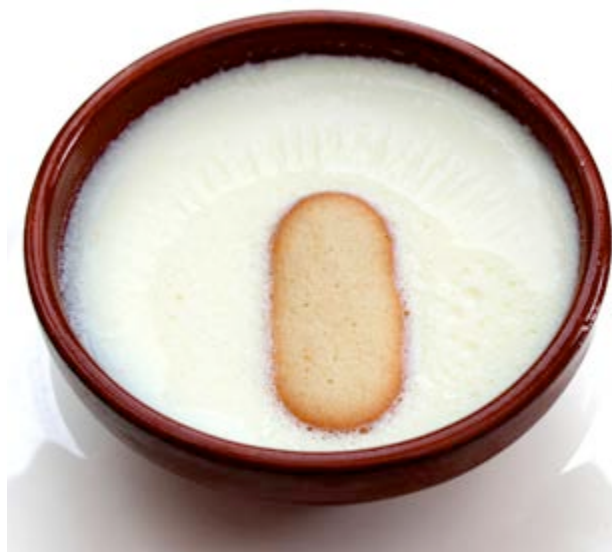
Los secretos de la cuajada tradicional

En Portell de Morella hay que probar la olla de recapte y las chuletas de cordero . Les pilotes de carn i les botifarres de ceba i arrós , así como el bolo y los chorizos , son ideales para un bocadillo que llevar a la excursión por el paraje. Los dulces también están llenos de calorías en forma de mantecadas , almendrados y rossegons .