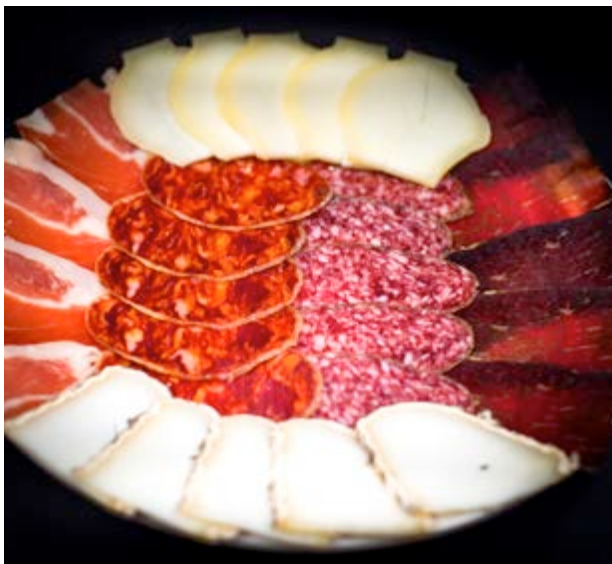
Te sorprenderá el bocado de los embutidos

En Castellfort son tradicionales los platos trufados , la cecina a la plancha y les rolletes tobés , pero además tienen platos asociados a festividades: para Santa Quiteria elaboran y decoran unas tortas que serán bendecidas antes de repartirlas en la Mare de Déu de la Font y en mayo, tras la romería de els Catinencs , les espera un guiso de alubias y arroz .