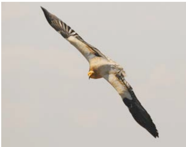
Quien divisa un alimoche nunca lo olvida

Conforme las paredes abruptas van ganando en altura aparecen los bosquetes maduros de pinos negrales , carrascales e incluso pino rojo y quejigos . Enebros , cornicabras ... la variedad es casi interminable si sumamos las