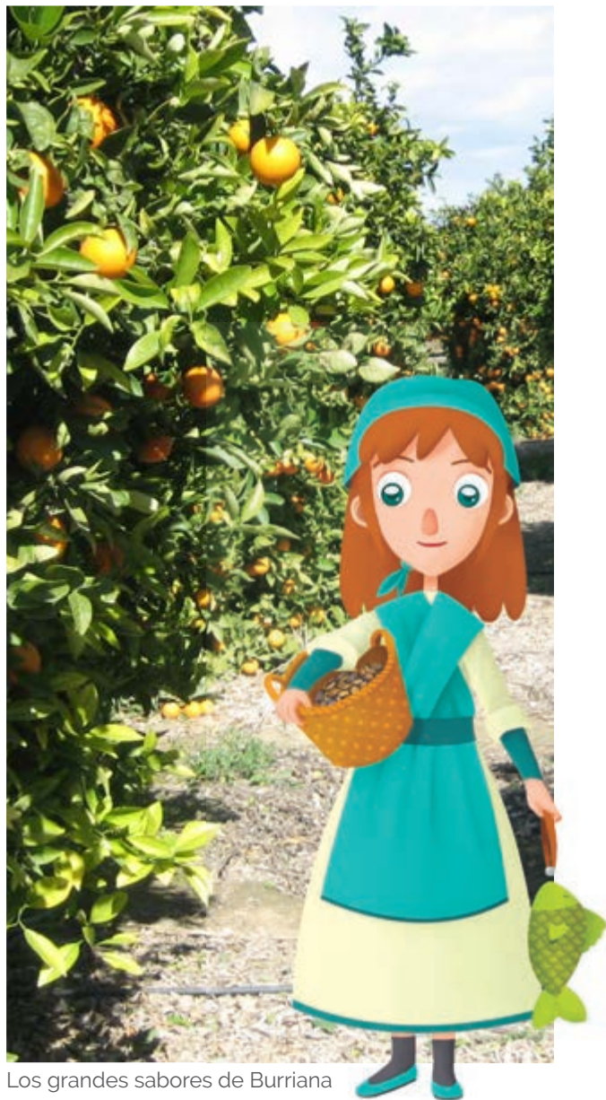
Los grandes sabores de Burriana

No dudes en acercarte a los restaurantes de la localidad para completar esta visita sensorial. Y no te olvides de pasar por un horno tradicional para probar la parte dulce, como los rollets de Sant Blai o las virutes de Sant Josep .