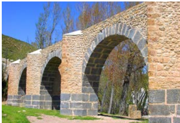
Acueducto romano Los Arcos

De camino a visitar las masías rehabilitadas, como las de Arteas , vale la pena pararse a estudiar cómo están contruidos los bancales , con bloques de piedra en seco, que alcanzan varios metros de altura, y que esconden refugios donde guarecerse.