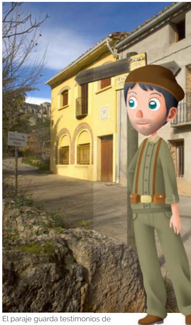
El paraje guarda testimonios de la Guerra Civil

abrupta pendiente hasta una hiedrera en un refugio natural. Allí pasaban una larga temporada y, cuando regresaban a por ellas, muchas habían sanado e incluso tenido crías.