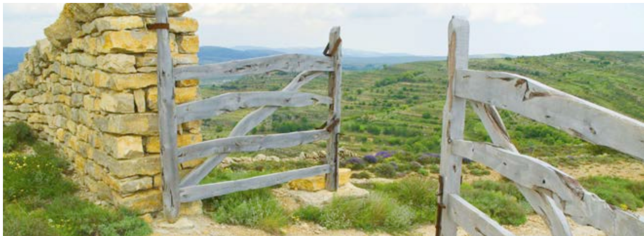
La Portera es la entrada al paraje

Dos áreas recreativas te permitirán descansar pero también te aportarán mucho más. La Font dels Regatxols , además de fuente con abrevadero, cuenta con un albergue municipal y la Nevera dels Regatxols es ahora un centro de interpretación de la antigua industria del hielo.