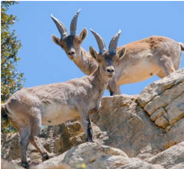
La cabra montés es la reina de los riscos

El viento, la geomorfología y el uso como lugar de pasto durante siglos han hecho de la mola lo que ahora vemos, le han conferido sus