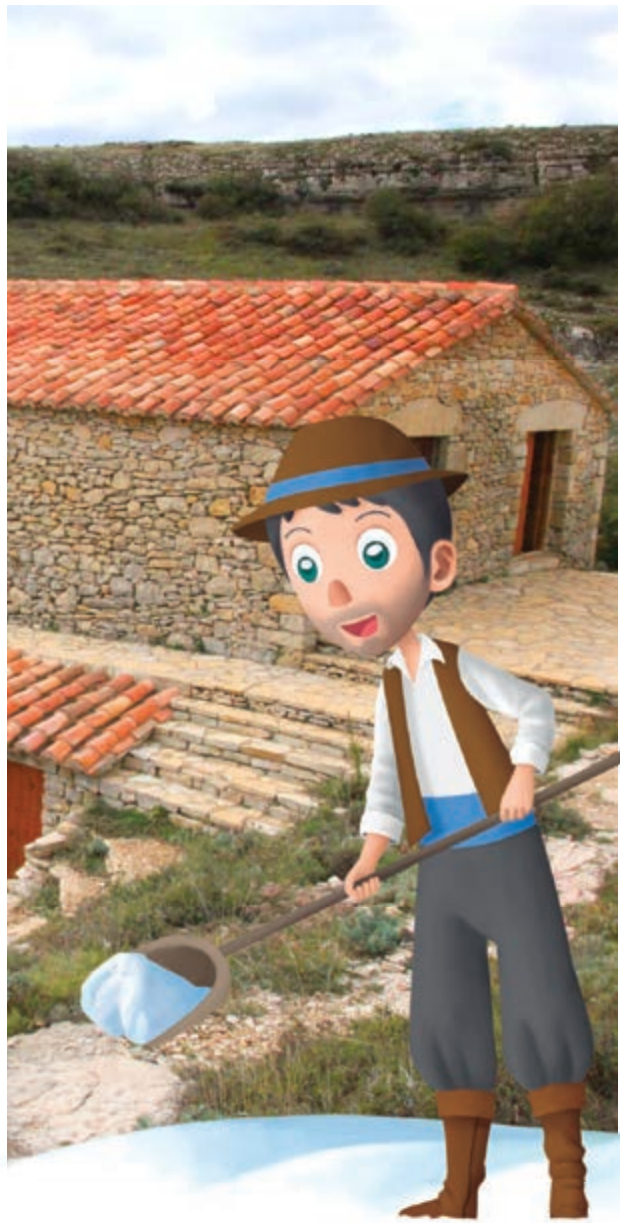
La sacrificada vida del nevater

Alrededor de 1910, se llenó por última vez la Nevera dels Regatxols , con su pozo de 8m. de profundidad donde el nevater guardaba la nieve, entre capas de paja, para formar bloques de hielo con los que comerciar. De noche llevaban el hielo hasta Castellón y Vina-roz y, a veces, hasta Barcelona. Tan próspera fue esta rudimentaria industria que incluso ayudó a pagar parte de la reconstrucción de la iglesia destruida en la Guerra de Sucesión. Hoy en día la Nevera sigue "viva" gracias a una recreación interpretativa tras ser restaurada.