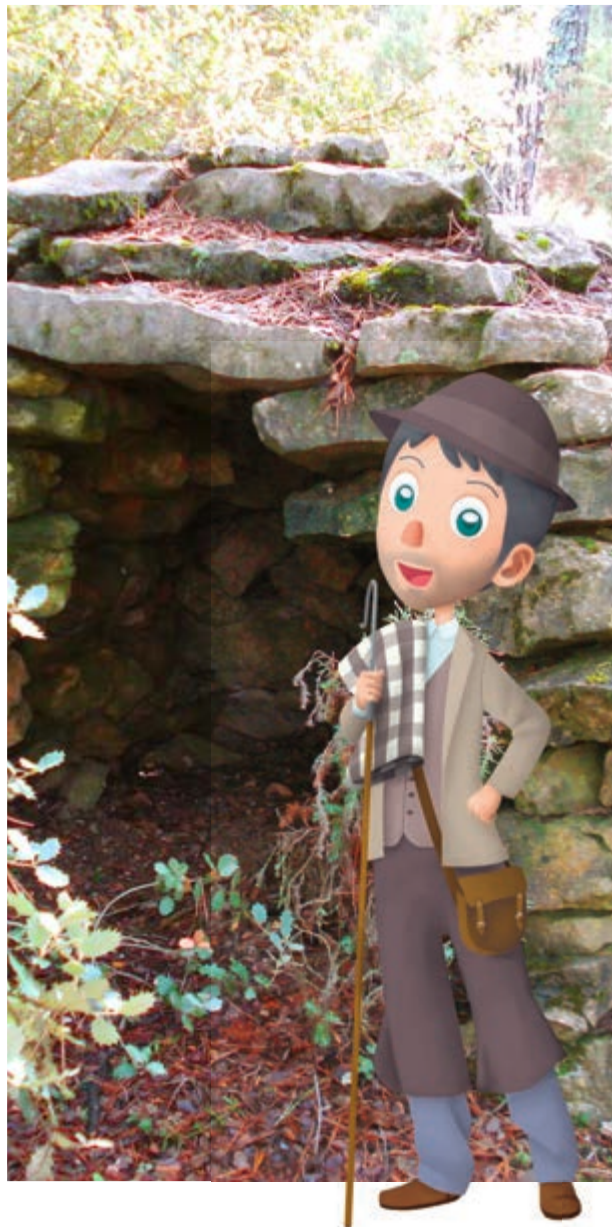
La tranhumancia, patrimonio cultural inmaterial

Los montes han sido y son muy importantes para la localidad de Altura. Además de como recreo, pulmón o lugar de peregrinación, sus montañas han proporcionado riqueza a la población. Por ejemplo, con el aprovechamiento maderero del monte de las Boqueras se pagaban los servicios municipales con lo que los vecinos ahorraban en impuestos. También se utilizaron antaño para el carboneo , los hornos de cal o el fuego del hogar.