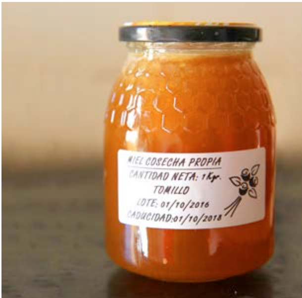
La miel, el néctar de la naturaleza

La tierra ha proporcionado a Altura diversas riquezas a lo largo de su historia. La vid perdió importancia hace unas décadas a causa de la filoxera y desaparecieron los cerezos, pero siguen en pie los almendros y los olivos .