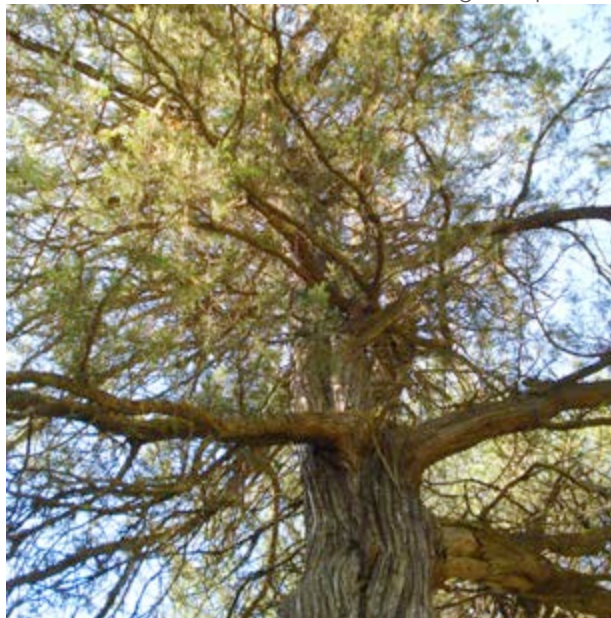
La sabina albar, un testigo del pasado

Poco a poco los animales, al igual que los árboles y arbustos, vuelven a poblar el paraje así que, cuando pasees por él, podrás encontrar corzos y liebres , la siempre simpática perdiz roja , puede que algún halcón peregrino en pleno vuelo o incluso sorprendas al escurridizo gato montés .