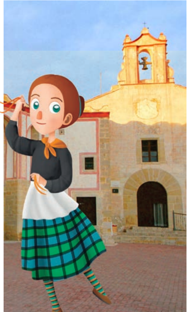
El ball de les camaraes celebra la recollecció de la garrofa

compensa amb molts altres usos per al gaudi de tothom . Les tradicions es mantenen però cuiden de la muntanya alhora.