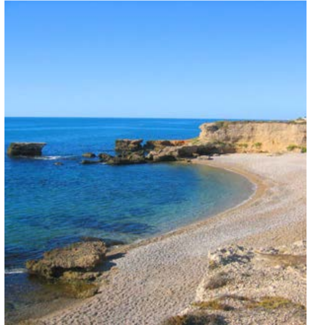
Cala Foradada, racó costaner de Vinaròs

modernista . Visita el seu Mercat Municipal . Hi ha tant que veure!