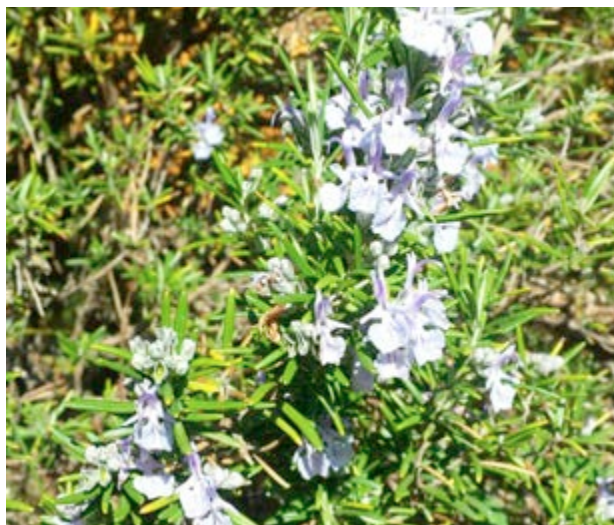
El romer ompli d'aroma el paisatge

A pesar del nombre de visites que rep aquest paratge, no són poques les espècies de fauna que podràs descobrir: fardatxos ocellats , serps , infinitat de pardalets , esquirols i inclús alguna simpàtica rabosa .