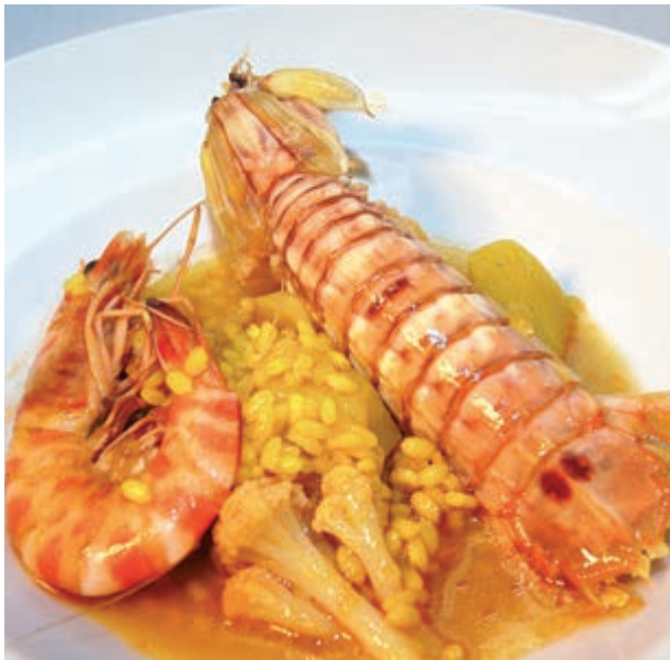
El saborós arròs amb llagostins i galeres

Vinaròs està orgullós dels seus forns tradicionals i ho mostra amb una guia específica sobre ells. Així que, sense excuses, caldrà anar i comprar coca de sal , coc de poma agredolç o de tomata i pinyons , bastonets amb farciments salats, pastissets diversos... Ideal per a emportar-se'ls d'excursió al paratge.