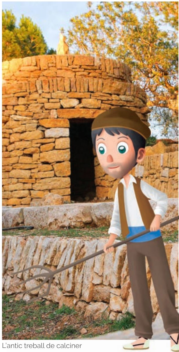
L'antic treball de calciner

Menys temps portarà recórrer la senda local Redona de l'Ermida , que circumda el paratge passant per la Torreta dels Moros , una torre sentinella medieval que avisava el poble de l'arribada de pirates. També es passa pel jaciment del poblat iber del Puig , prop de la gran creu, i per uns quants forns de calç abandonats. Moltíssima varietat en a penes 4 quilòmetres de recorregut.