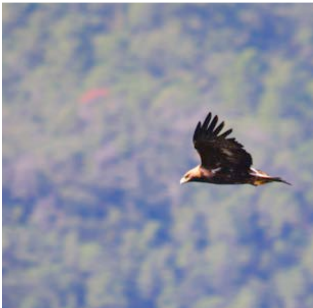
L'esglaiador vol de l'àguila reial

Alguns animals agraeixen de forma especial el paisatge agrest, com la cabra salvatge , els