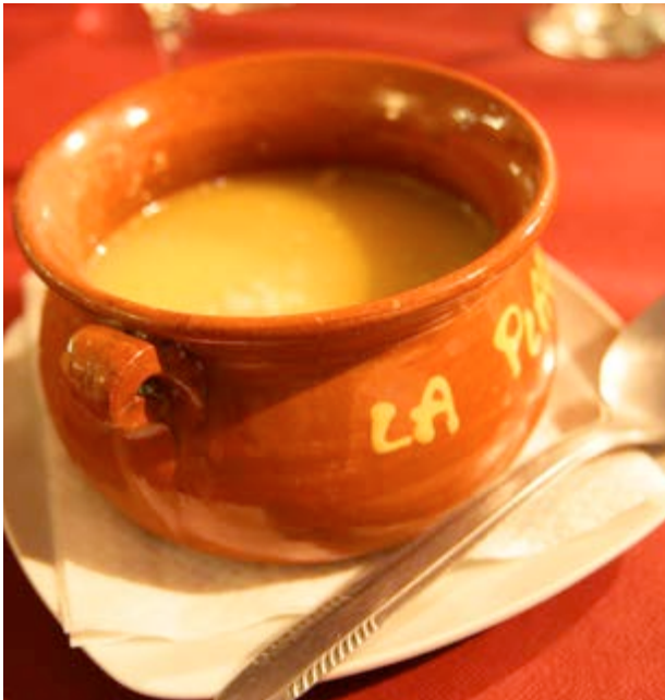
L'olleta és perfecta per a recuperar forces

Les carns són contundents i saboroses des del tombet al corder tendral o les carns a la brasa i els embotits . Per a quan fa falta quelcom calent que entone el cos, l'olleta , l'arròs al forn o l'arròs amb abadejo són el millor.