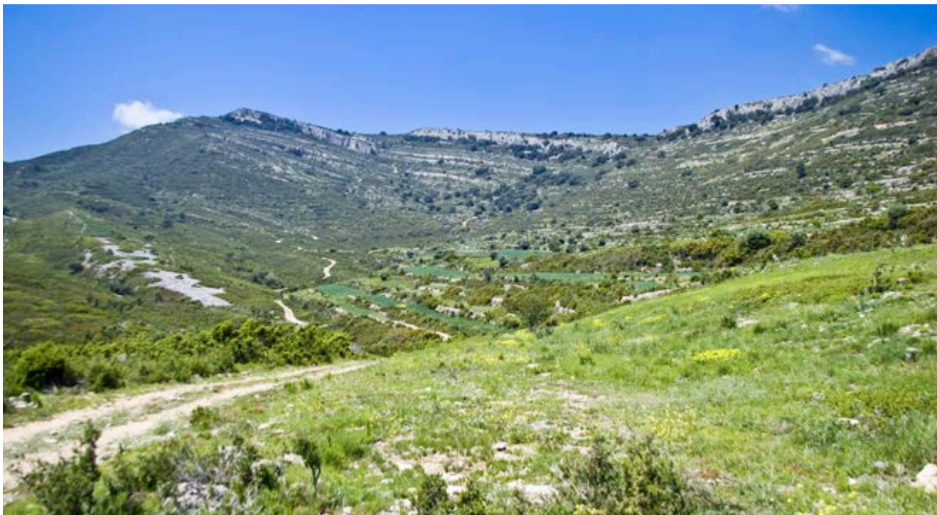
A través de les sendes podràs descobrir el paisatge rupícola

A penes són 7 quilòmetres encara que amb un cert desnivell, que et portaran per paisatges que, a primera vista, pareixen inhòspits però que són d'una bellesa immensa .