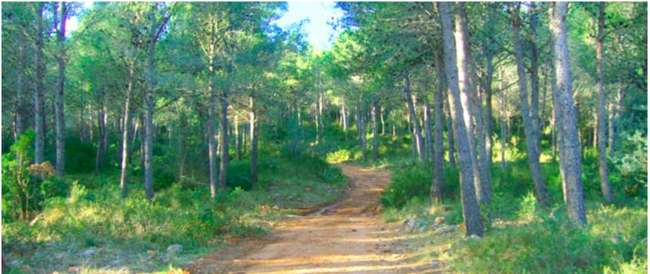
De bovalar a bosc, l'evolució d'un paisatge

Amb el transcurs del temps, la ramaderia va anar perdent importància i els terrenys van haver de buscar nous usos , com els forns de calç , o l'aprofitament de la fusta per la qual cosa, en 1955, es va repoblar amb pi blanc . I així és com el gaudim ara, a pesar del xicotet i jove que és, sense que estàs en tot un bosc madur.