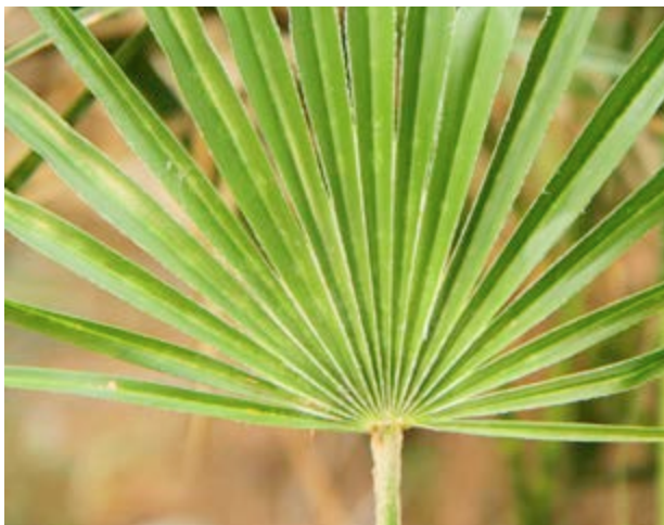
El margalló és l'única palmera autòctona de la Península Ibèrica

A la dreta de l'esplanada d'entrada trobaràs una àrea recreativa amb zones de paellers i barbacoes , piques amb aigua, taules i bancs baix els pins. Amb això i tot el terreny que tens per a explorar, passar un dia de descans en el paratge és la mar de senzill i còmode.