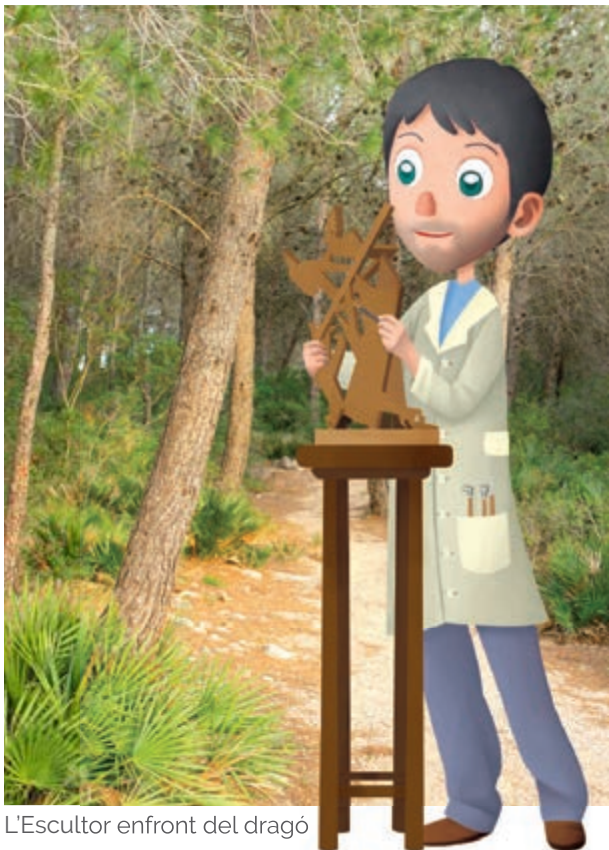
L'Escultor enfront del dragó

Els seus camins són amples, plans i agradables de recórrer mentres es goja dels sons de la naturalesa o es manté una agradable xarrada si vas amb companyia.