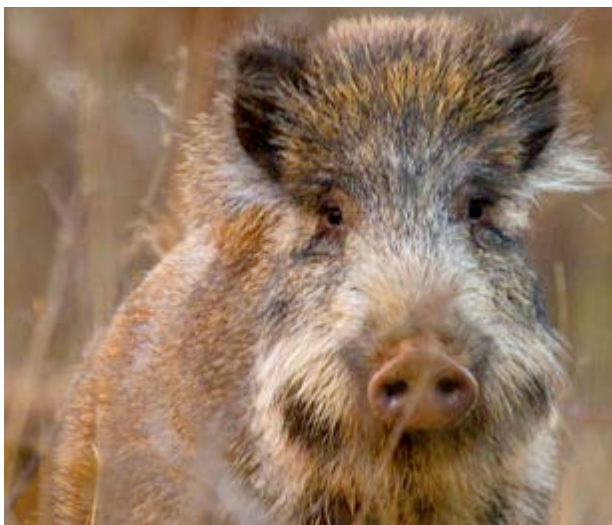
Si no veus el porc senglar, veuràs les seues emprentes

Els animals són els que més gojen del lloc i això es nota en la diversitat que es pot trobar-hi. La cabra salvatge i el porc senglar són prou fàcils de veure. Els rabosots , per desgràcia, són cada vegada més escassos. Més atenció caldrà posar per a veure els esquirols , el gamarús o el pit-roig . Escolta amb atenció perquè no seria estrany que sentires el picot garser gros en ple treball.