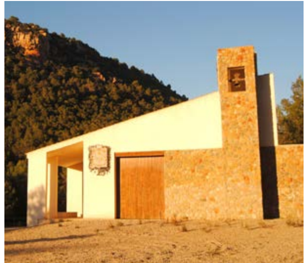
L'ermita de Sant Vicent Ferrer

La localitat ha apostat per la cultura i per la recuperació de les tradicions. Per això organitzen un Festival de Teatre a l'aire lliure , la Mostra Tradicional , el Cinema d'estiu i rememoren jocs d'antany com els birles i els canuts en les seues Festes Patronals . I no hem d'oblidar la romeria que organitzen a l'abril a l'ermita de Sant Vicent Ferrer , situada a un altre dels seus tresors naturals, la Font de Ros .