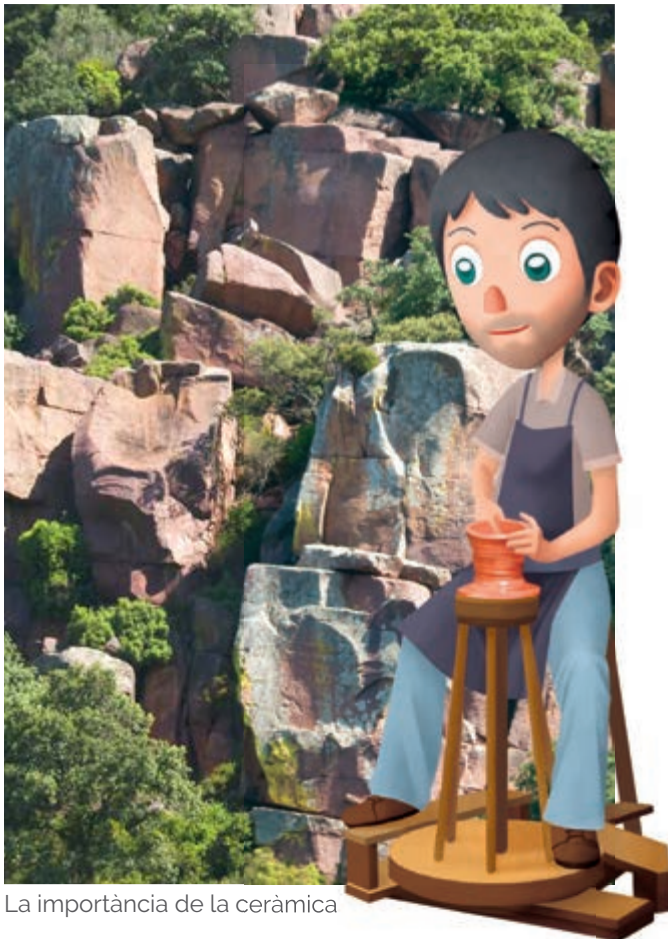
La importància de la ceràmica

El terme de Sant Joan de Moró ha estat ric en cultius de secà com l'ametlla , l'olivera i les garroferes . Precisament, pegada al tronc d'aquestes últimes es troba la birla de garrofera , una classe de bolet molt apreciada en la cuina i que en aquesta localitat preparen de forma deliciosa.