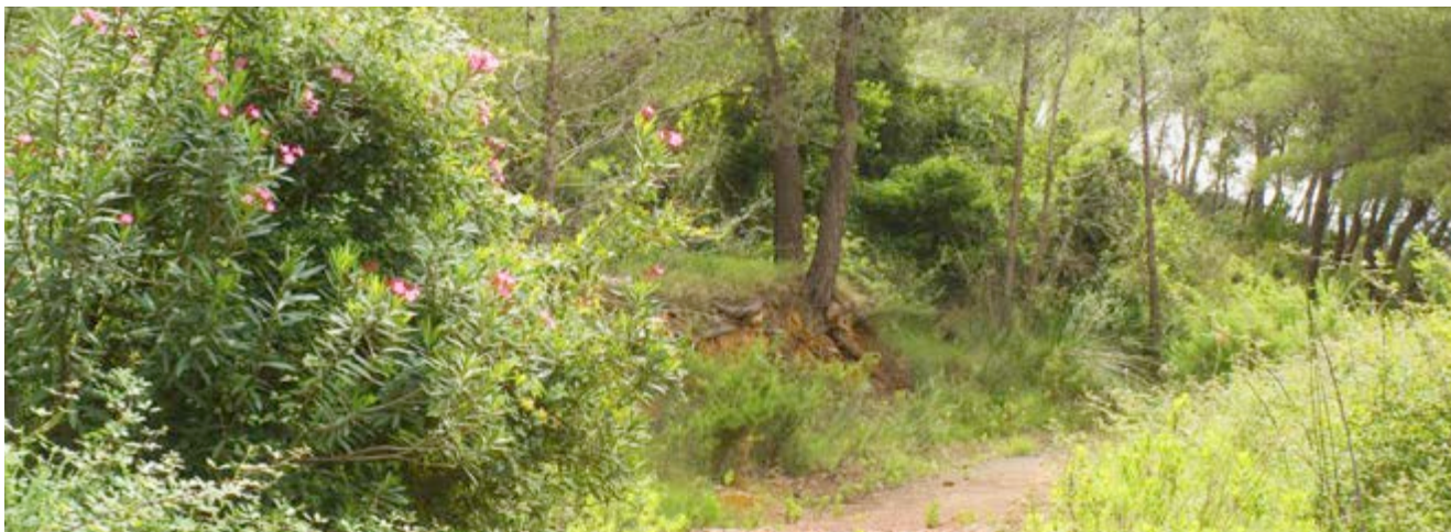
Una de tantes sendes per explorar

A més, si la teua curiositat et porta a explorar cada xicoteta senda, pots descobrir uns antics i profunds pous de mines que van ser oberts a base de xicotetes ferramentes, força i paciència per a extraure d'ells minerals pesats.