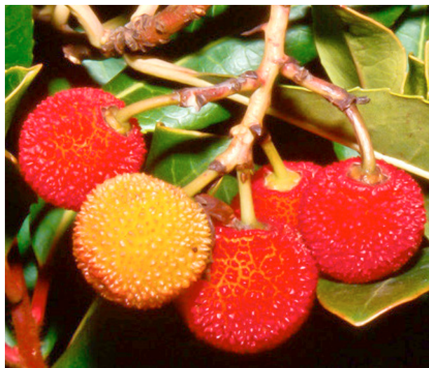
L'alborç no es troba en qualsevol paratge