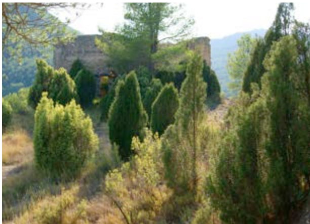
Les ginebres custodien el castell

És fàcil imaginar Cavanilles o el Cid, gaudint el seu pas per aquestes terres, seguint el curs del riu Millars. A que tu també el veus serpentejant entre tantes muntanyes?