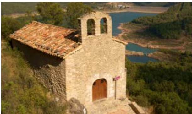
Una ermita amb llegenda

La romeria era pròpia de les masies de Los Arcos i la Rambla Alta, que van desaparèixer al construir l'embassament, però es va voler recuperar la tradició partint els pelegrins des de la Puebla de Arenoso. Se celebra el 2 d'agost i a l'arribar s'assisteix a missa i es reparteixen rotllos beneïts. Antigament es feia la caritat i