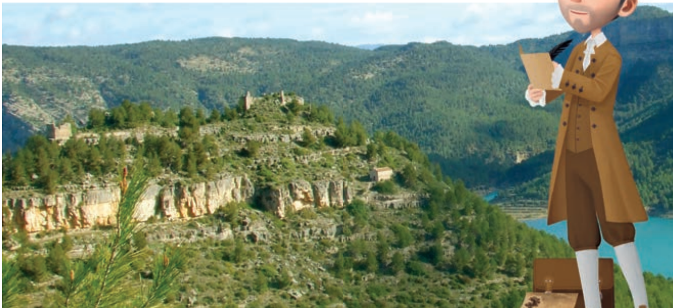
En el segle XVIII Cavanilles va il·lustrar aquest mateix paisatge

I si el teu és la bicicleta de muntanya també t'encantarà el xicotet repte de visitar aquest paratge.