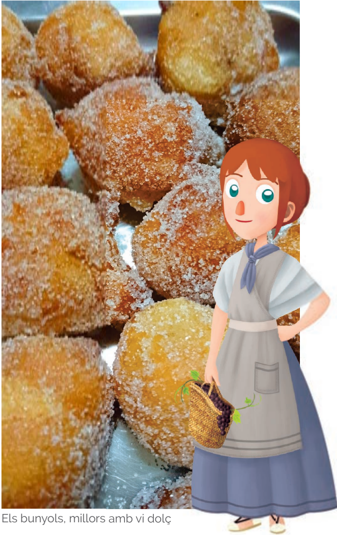
Els bunyols, millors amb vi dolç

E ncara que a penes veuràs horts i camps quan arribes a la Puebla de Arenoso, en altres temps els va haver-hi en bancals que