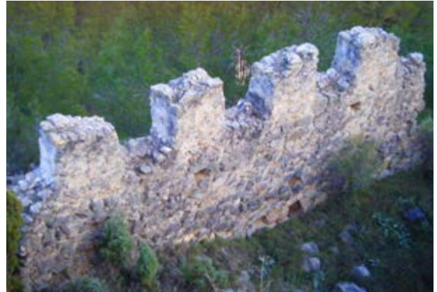
El Castell de la Viñaza. Origen del poble

també s'aprofitava per a organitzar una espècie de xicoteta fira on cada u comprava i venia el que podia.