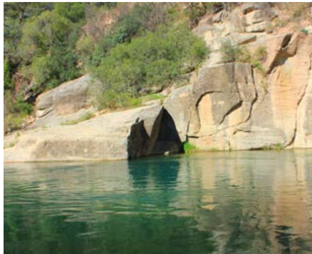
El Pozo de las Palomas, una piscina natural

car-se a l'estiu, perquè es tracta d'uns tolls d'aigua clara, on la gent del poble ha anat a banyar-se des de sempre.