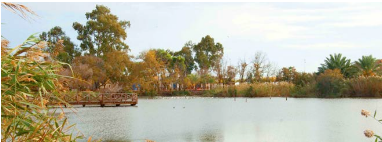
El paratge té un dels pocs equipaments catalogats com accessibles per PREDIF

Per a les persones amants de les grans rutes, el GR-36 , que va des de la Vilavella a Montanejos, es pot allargar a penes uns 7 quilòmetres més per a tindre l'eixida a la mar. Així el recorregut serà més que complet, des de la mar fins una de les més altes i belles serres de Castelló, l'Espadà.