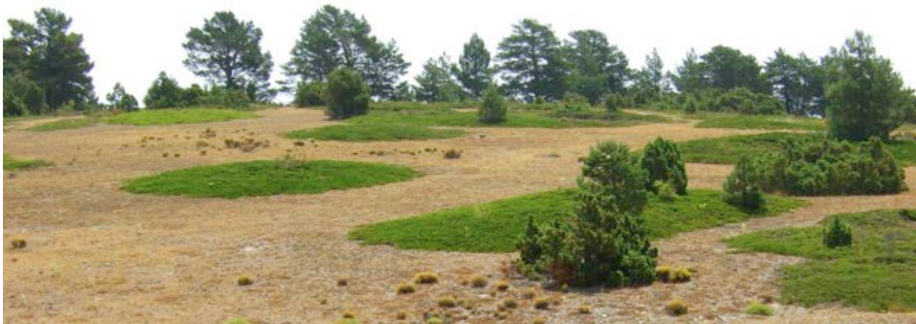
La savina rastrea i el coixi de monja conformen un paisatge singular

I després camina o recorre les sendes amb la teua bicicleta de muntanya el temps suficient com per a obrir la gana. El Toro t'espera amb un munt de coses delicioses.