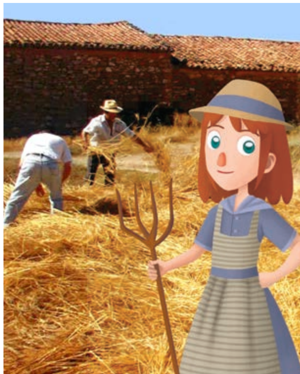
Fiesta de la Siega y la Trilla

ment del riu Palància . La senda per a arribar fins a ell està perfectament senyalitzada.