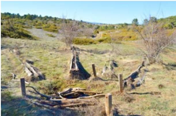
El Pozo Junco, un brollador d'alta muntanya

La primera, la natural, és el paisatge d'alta muntanya acostumat a la neu i el fort vent que han anat conformant una vegetació baixa, abaldufada, arran de sòl la més abundant. La savina rastrera i el coixí de monja cobreixen