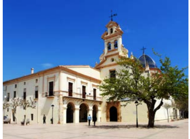
La basílica del Lledó

conatedral de Santa Maria i la seua basílica del Lledó .