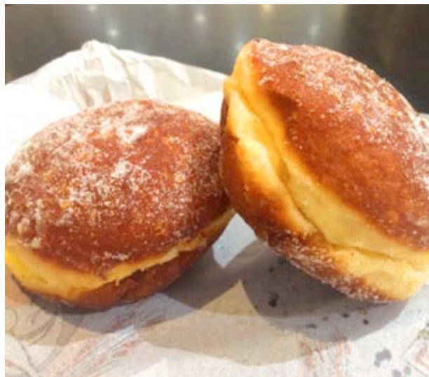
Xicotets trossos de cel

galeres i carrancs ... I la fideuà o l'olleta de la Plana repleta de sanes verdures, hortalisses i llegums.