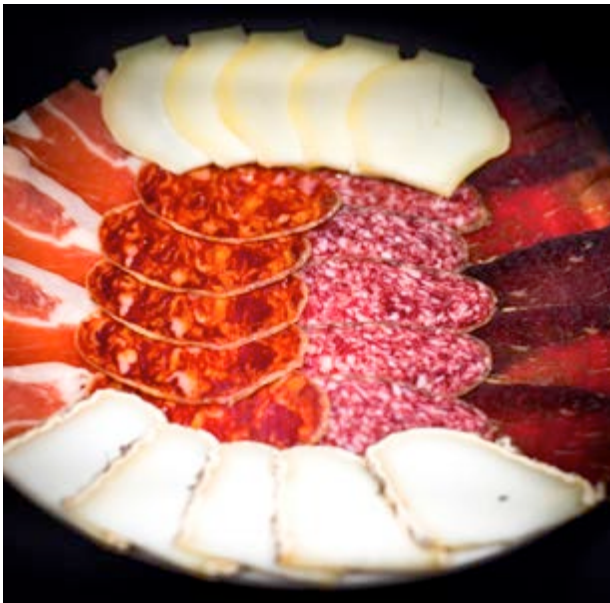
Et sorprendrà el mos dels embotits

A Castellfort són típics els plats trufats , la carn salada i fumada a la planxa i les rolletes tobés , però a més tenen plats associats a festivitats: per a santa Quitèria elaboren i decoren unes coques que seran beneïdes abans de repartir-les a la Mare de Déu de la Font i al maig, després de la romeria dels Catinencs, els espera un guisat de fesols i arròs .