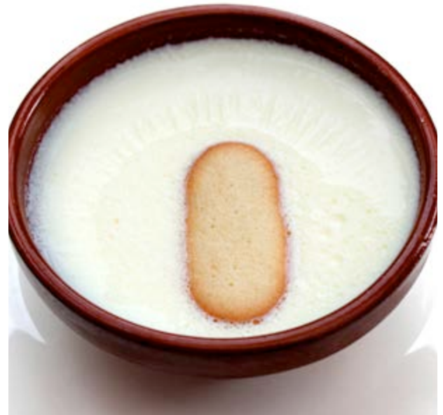
Els secrets de la quallada tradicional

Al Portell de Morella cal provar l' olla de recapte i les xulles de corder . Les pilotes de carn i les botifarres de ceba i arròs així com el bolo i els xoriços són ideals per a un entrepà que portar a l'excursió pel paratge. Els dolços també estan plens de calories en forma de mantegades , ametlats i rossegons .