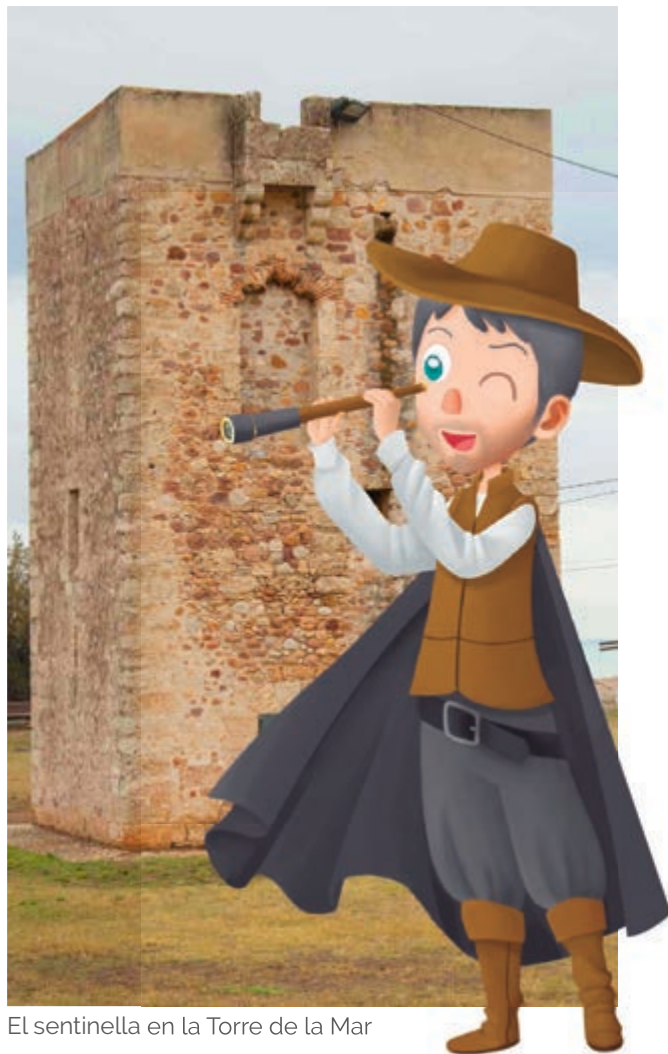
El sentinella en la Torre de la Mar