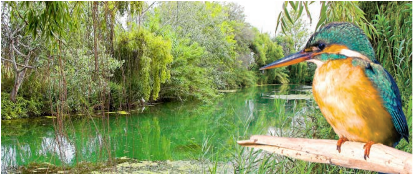
El blauet és indicador de la bona qualitat de l'aigua

Encara que, sens dubte, el més característic del paratge, si parlem de naturalesa, és la gran quantitat d'aus que podràs trobar. Podràs veure ànecs collverds , cabussonets o fotges banyant-se, cormorans prenent el sol sobre les branques més altes, amb les seues ales desplegadas, infinitat de pardalets amagats en les copes dels arbres o el blauet fent alguna de les seues ràpides passades amb el seu vol rasant i fugaç.