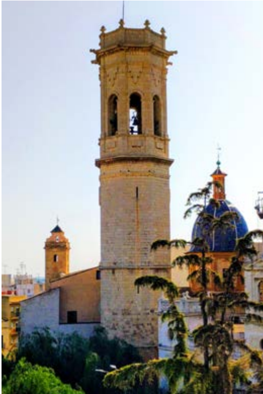
Basilica menor de El Salvador

E l passeig pels tres quilòmetres que rodegen el paratge, les fotografies, els ensomnis junt amb la torre o l'escolta atenta dels ocells segur que et deixaran amb ganes de més. Per sort, Borriana amaga molts més tresors.