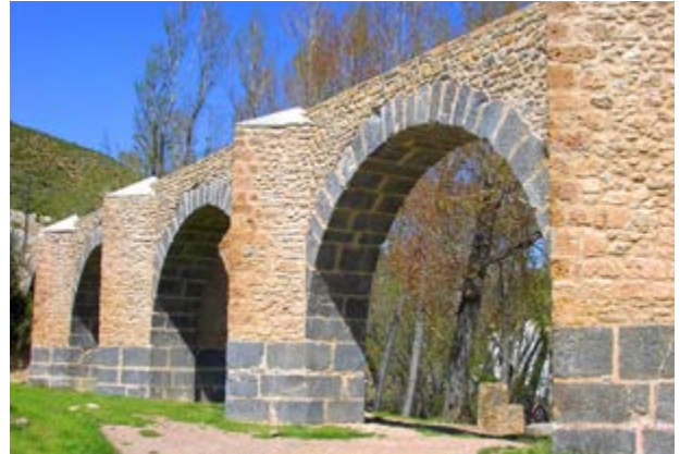
Aqüeducte romà Los Arcos

De camí a visitar les masies rehabilitades, com les d'Arteas , val la pena parar-se a estudiar com estan construïts els bancals , amb blocs de pedra seca, que arriben a diversos metres d'altura, i que amaguen refugis on arrecerar-se.