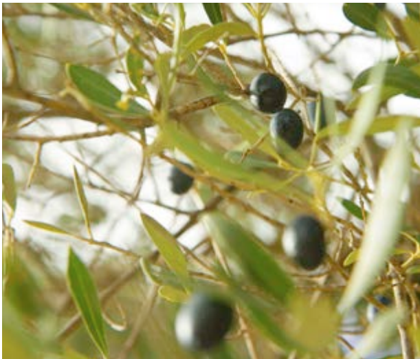
Or líquid de l'Alt Palància

Els plats que poden assaborir-se en aquesta localitat són ben contundents i saborosos. L'olla reviu a qualsevol. Igual que l'arròs d'olla que serveixen caldós i ben calent.