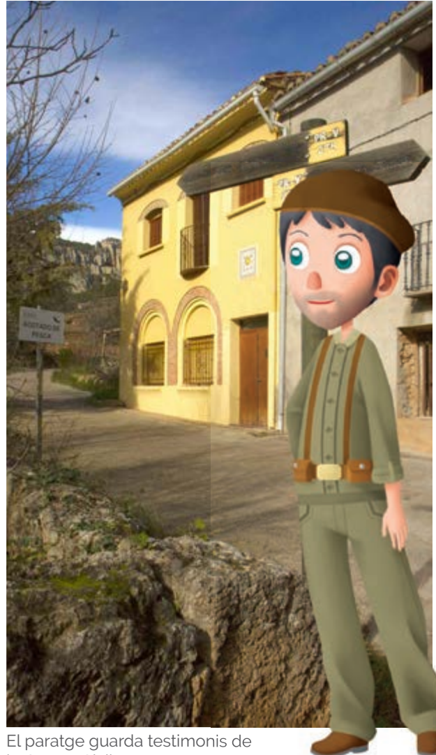
El paratge guarda testimonis de la Guerra Civil

refugi natural. Allí passaven una llarga temporada i, quan tornaven a per elles, moltes havien curat i inclús tingut cries.