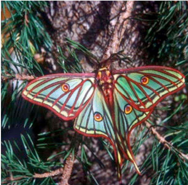
Peñaescabia un dels últims refugis de la Graellsia

A les Peñas de Amador , les repoblacions de pi negral i pi blanc van a trobar-se, barranc