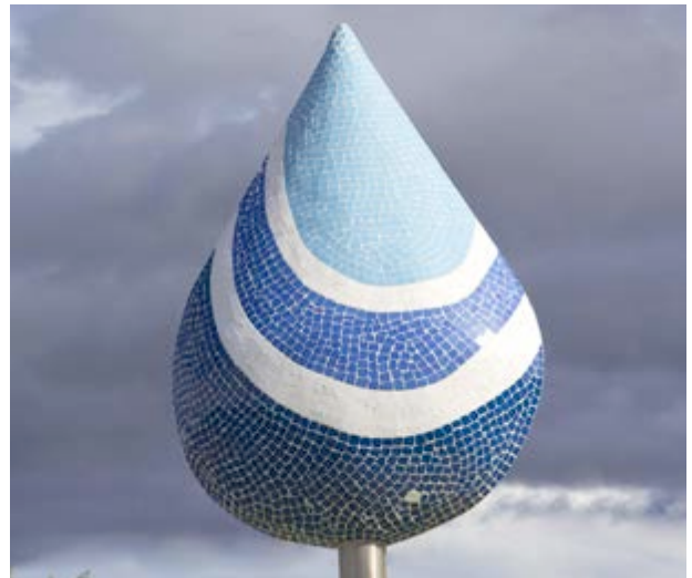
Aigua de Bejis, font de vida i progrés

Caldrà caminar molt per a cremar tant menjar!