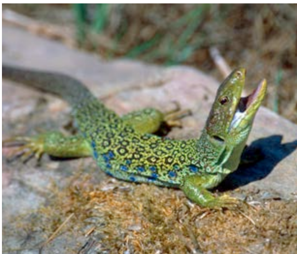
El fardatxo ocellat pot arribar a mesurar 70 cm

Al voltant de la zona del Castell trobem zones de pi halepensis esguitades per zones de carrasques . Inclús, en zones més fresques, apareixen altres exemplars de la família dels