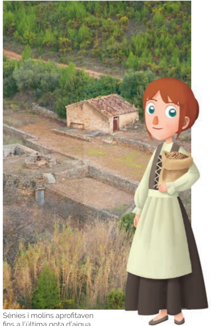
Sénies i molins aprofitaven fins a l'última gota d'aigua

aprofitava els seus recursos . Encara avui es poden veure restes d'antics molins i sénies , tant en els barrancs i rierols que rodegen el paratge com a tot el terme municipal.