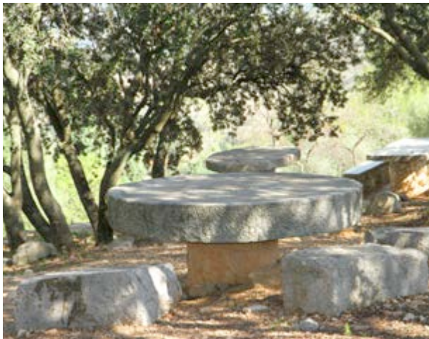
La zona del berenador t'espera davall les carrasques

Des del monticle sobre el qual s'assenta el Castell s'albira l'estreta senda per la qual es pot baixar als tolls que es formen en la rambla , just als seus peus, i que són les delícies de tothom, encara que sobretot dels més joves, quan estreny la calor de l'estiu.