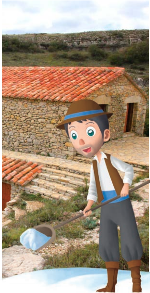
La sacrificada vida del nevater

Al voltant de 1910, és va omplir per última vegada la Nevera dels Regatxols , amb el seu pou de 8m. de profunditat on el nevater guardava la neu, entre capes de palla, per a formar blocs de gel amb què comerciar. De nit portaven el gel fins a Castelló i Vinaròs i, a vegades, fins a Barcelona. Tan pròspera va ser aquesta rudimentària indústria que inclús va ajudar a pagar part de la reconstrucció de l'església destruïda en la Guerra de Successió. Avui en dia la Nevera segueix "viva" gràcies a una recreació interpretativa després de ser restaurada.