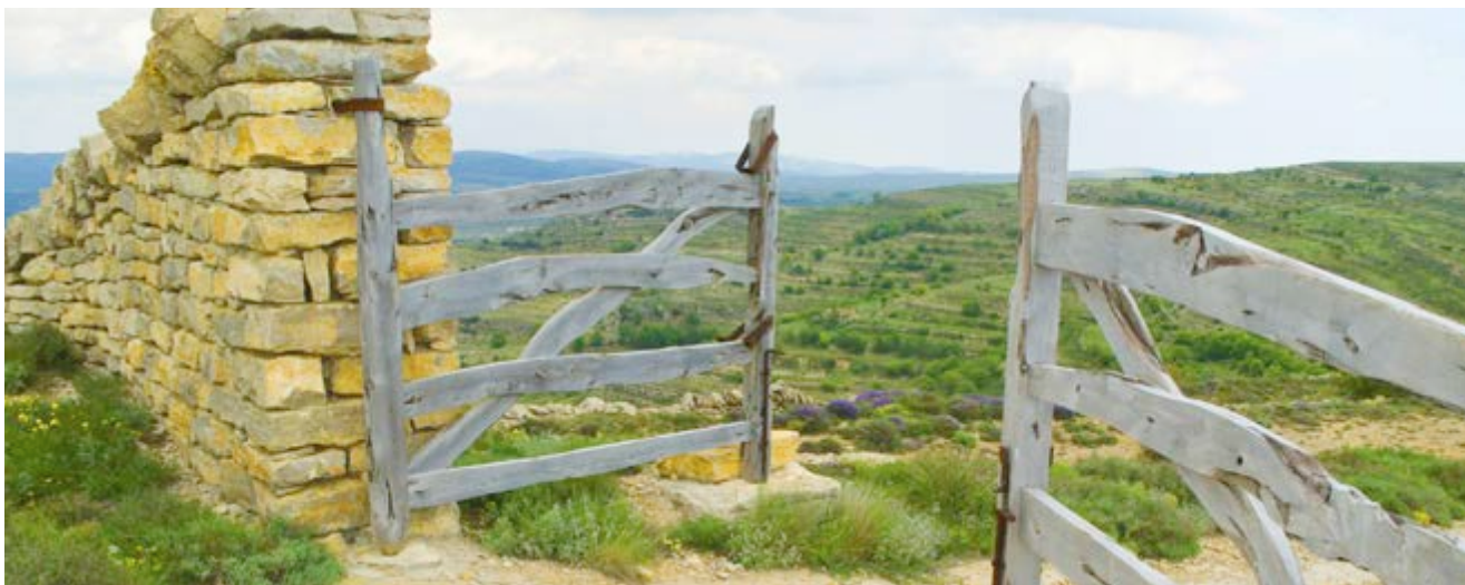
La Portera és l'entrada al paratge

Dues àrees recreatives et permetran descansar però també t'aportaran molt més. La Font dels Regatxols , a més de font amb abeurador, té un alberg municipal i la Nevera dels Regatxols és ara un centre d'interpretació de l'antiga indústria del gel.