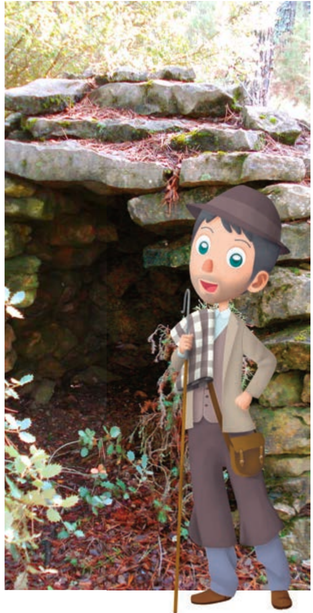
La tranhumància, patrimoni cultural immaterial

Les muntanyes han estat i són molt importants per a la localitat d'Altura. A més de com a recreació, pulmó o lloc de pelegrinatge, les seues muntanyes han proporcionat riquesa a la gent. Per exemple, amb l'aprofitament fuster de la muntanya de les Boqueres es pagaven els serveis municipals amb els quals el veïnat estalviava en impostos. També es van utilitzar antany per al carboneig , els forns de calç o el foc de la llar.