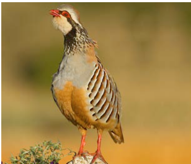
La bellíssima perdiu roja

Alguns amagatalls es mantenen quasi intactes i mostren la gran varietat de flora i fauna que pot albergar aquest paratge, com en els barrancs pròxims a la Font de la Torrecilla , on els xops segueixen brindant-nos els seus canvis de colors en cada estació.