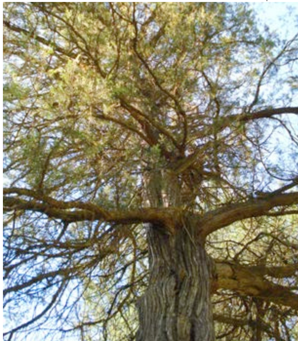
La savina turífera, un testimoni del passat

A poc a poc els animals, igual que els arbres i arbustos, tornen a poblar el paratge així que, quan passeges per ell, podràs trobar cabirols i llebres , la sempre simpàtica perdiu, potser algun falcó pelegrí en ple vol o inclús sorprengues el poruc gat salvatge .