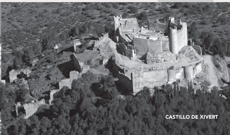
CASTILLO DE XIVERT